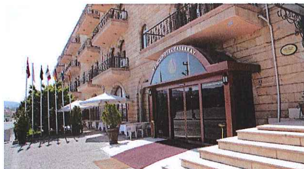
HOTEL TASSARAY - CAPPADOCIA